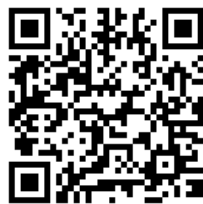
三芳小ホームページQRコード

本校では、ホームページ「見て見てみよっ子」を通して子供たちの学習の様子をお伝えしています。たくさんの方々に閲覧していただいておりますが、今後もできる限り更新していきますので是非ご覧ください。