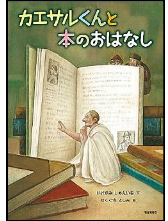
カエサルくんと本のおはなし