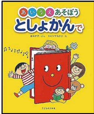
あいうえあそぼうとしょかんで