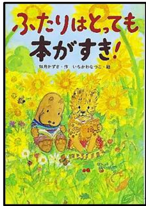
ふたりはとっても本がすき!