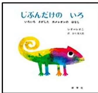
じぶんだけのいろ

読んでいただいた本は図書室にあります。春休み中にお家の人と読みたくなったらまち としょかん 町の図書館にもあります。ぜひ読んでみてください。