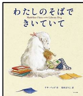
わたしのそばできいていて

—いろいろな色がしたカメレオンのはなし— レオ=レオニ作 谷川俊太郎/訳 好学社