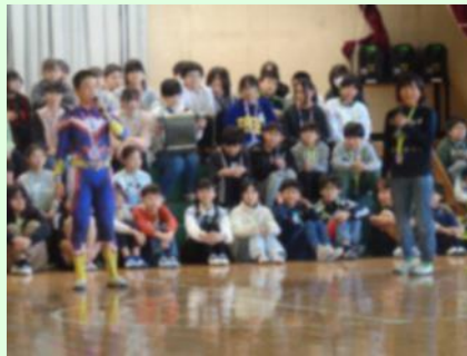
6年生から在校生へのメッセージ