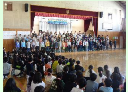
6年生から在校生へ歌のプレゼント