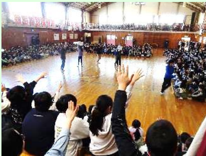
在校生から6年生へ感謝の気持ちを伝えて

この行事をきっかけに学校は、一気に卒業証書授与式・修了式へと駆け上がっていきます。この1か月を大切に、よい締めくくりができるように指導をしていきます。そして、藤久保小の子どもたち全員が“有終の美”を飾れるようにしていきたいと思います。保護者、地域の皆様、今月も藤久保小学校の教育活動にご理解とご協力をよろしくお願いいたします。