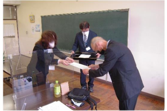
▲ 校長より委員の皆様へ、委嘱状を手交いたしました。

協議に先立ち、委員の皆様への委嘱状交付、自己紹介及び役員選出を行いました。今年度の委員については下表をご覧ください。