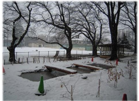
▲ 雪の日のビオトープ