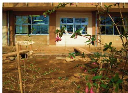
▲ ビオトープにウグイスカグラの花が咲きました